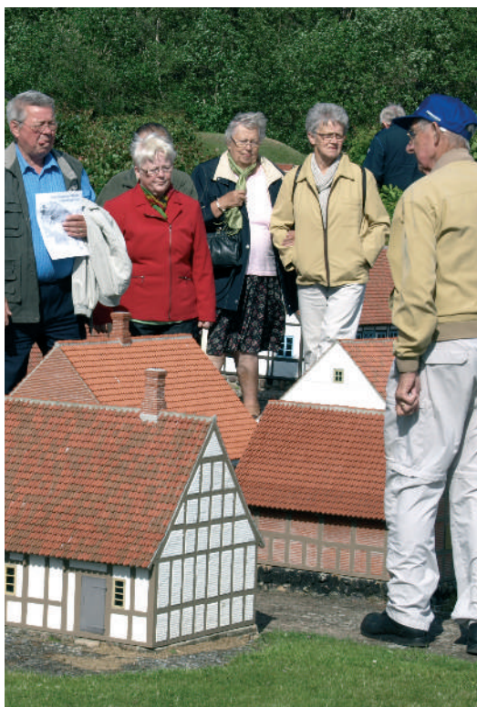
Fra Ældreudflugten til Fredericia.

Man behøver blot at ringe til Ullerslev Taxi Tlf.: 6535 2155