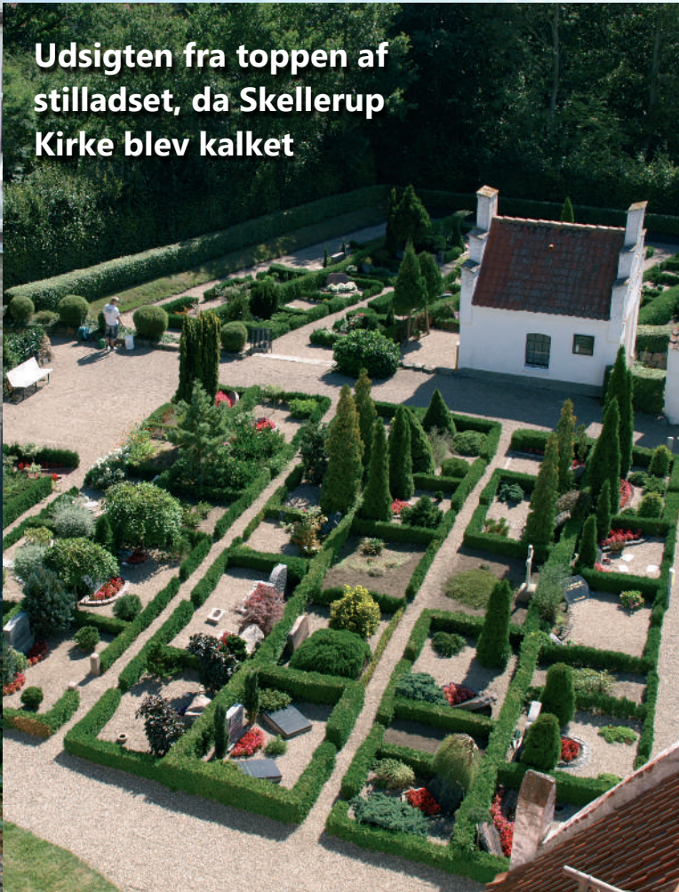
Udsigten fra toppen af stilladset, da Skellerup Kirke blev kalket