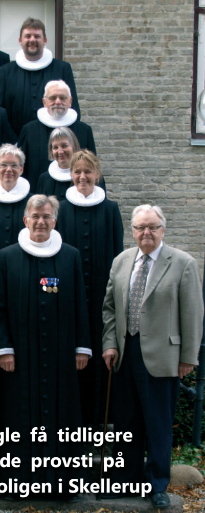
gle få tidligere de provsti på oligen i Skellerup