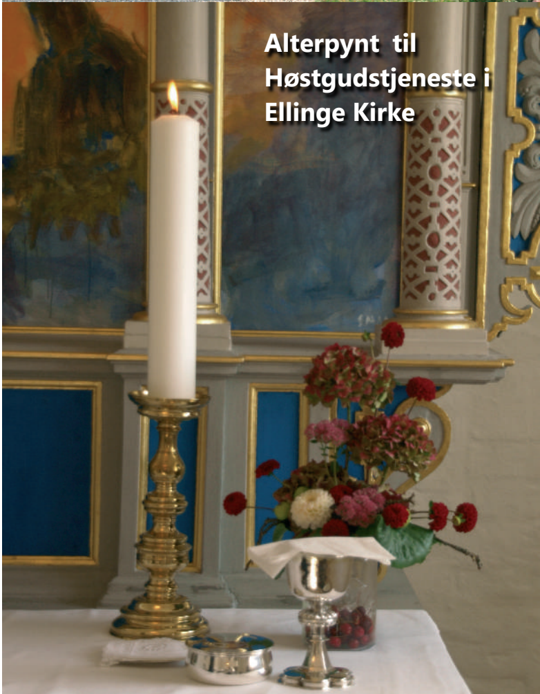
Alterpynt til Høstgudstjeneste i Ellinge Kirke