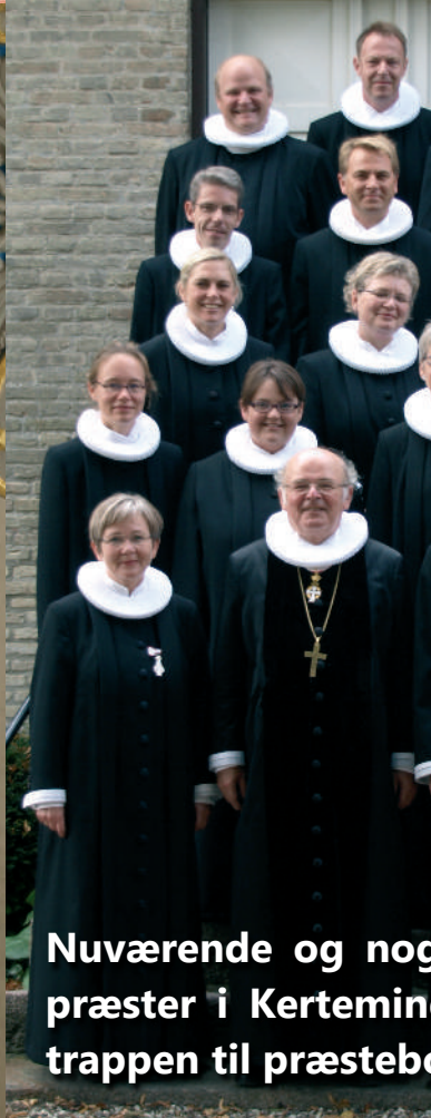
Nuværende og nogle præster i Kerteminde trappen til præsteborg