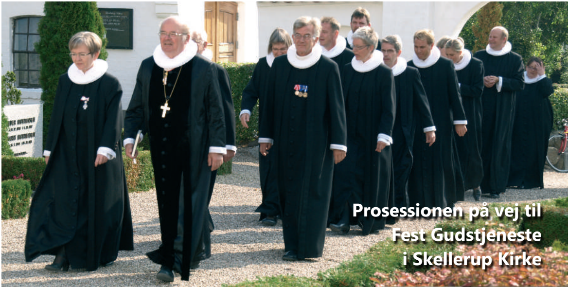
Prosessionen på vej til Fest Gudstjeneste i Skellerup Kirke