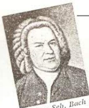
Johan Seb. Bach