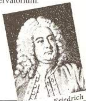
Georg Friedrich Händel

Barokken kendetegnes som værende storslået og overvældende, og dette er også gældende for musikken. Bach og Händel komponerede dog meget forskelligt, hvilket vil være at høre ved aftenens koncert. Hvor Bach er den udspekulerede, er Händel mere fintfølede. De tre musikere bor alle i Odense og er tilknyttet Det fynske Musik-konservatorium.