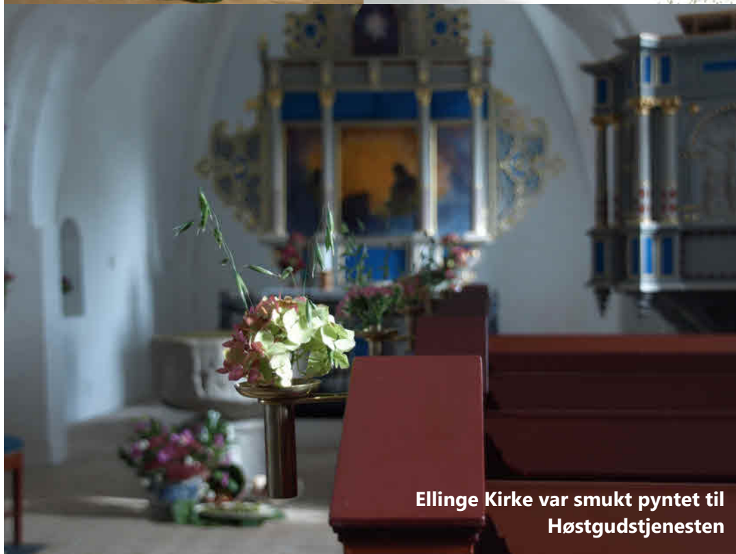
Ellinge Kirke var smukt pyntet til Høstgudstjenesten